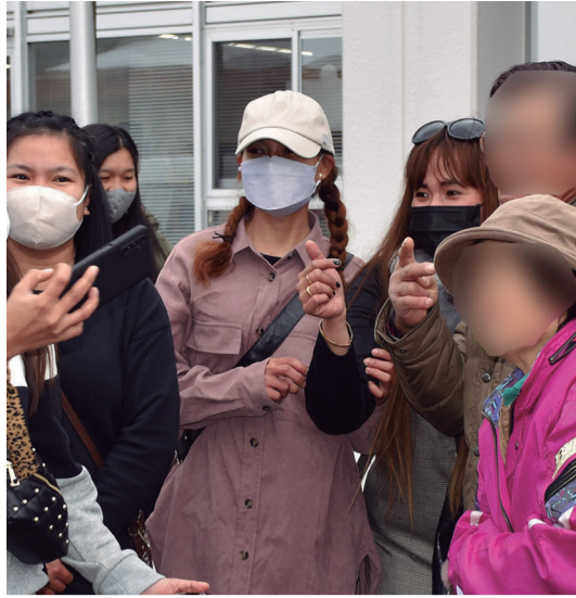
九州への出発式に参加したフィリピン人ら

夏は仁木、冬は九州で。新おたる農協(後志管内仁木町)と全国農協連合会福岡県本部が連携し、即戦力で働ける「特定技能」の在留資格を持つ外国人を互いの繁忙期に雇い合う、「産地間人材リレー」に取り組んでいる。仕事のない冬場は九州で働き、春にUターンする好循環ができれば、人手不足の解消にもつながるからだ。